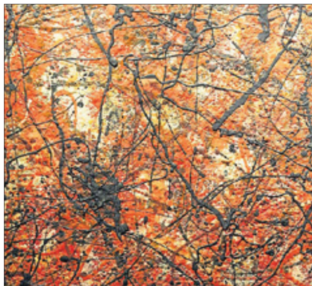
Ott Neuens investit l'espace d'exposition à Kehlen.

Artium Art Gallery: Andreas E. Furtwängler, Skulpturen und Bilder. Bis 30. März.