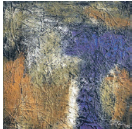
Eines der Werke aus der Reihe „Les Couleurs de la Terre“