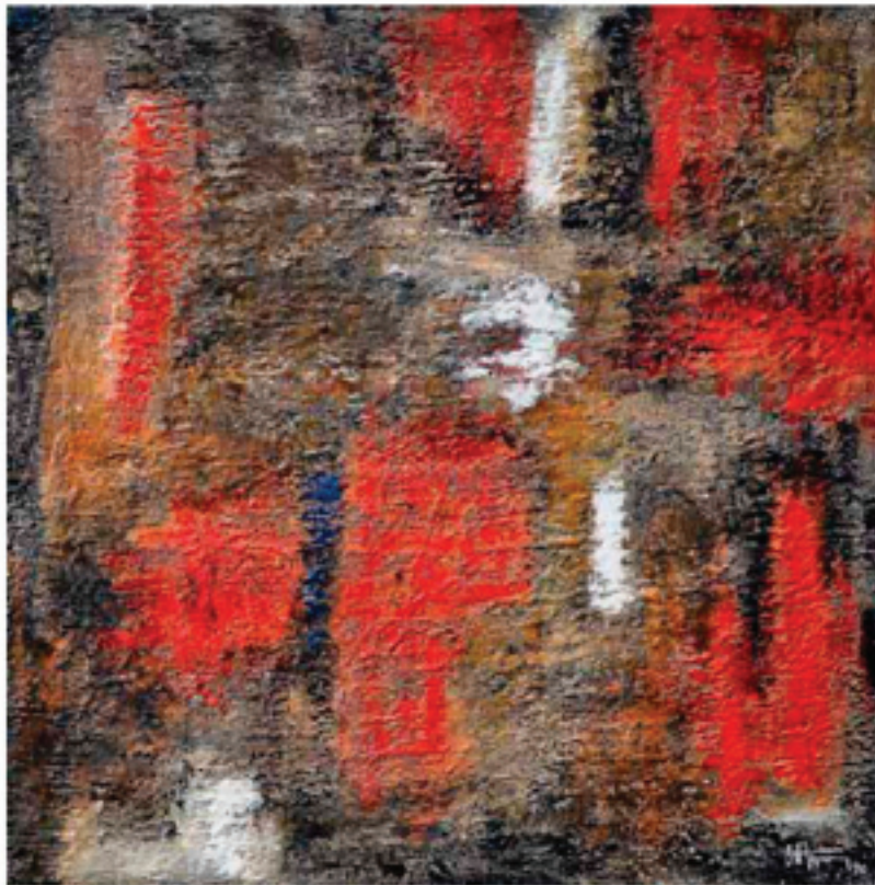
Ott Neuens ne travaille que sur de la cire d'abeille, une base qui se marie à merveille avec les pigments de la terre.

EXPOSITION Le Luxembourgeois Ott Neuens expose, à partir de demain, ses «Couleurs de la terre» à Kehlen.